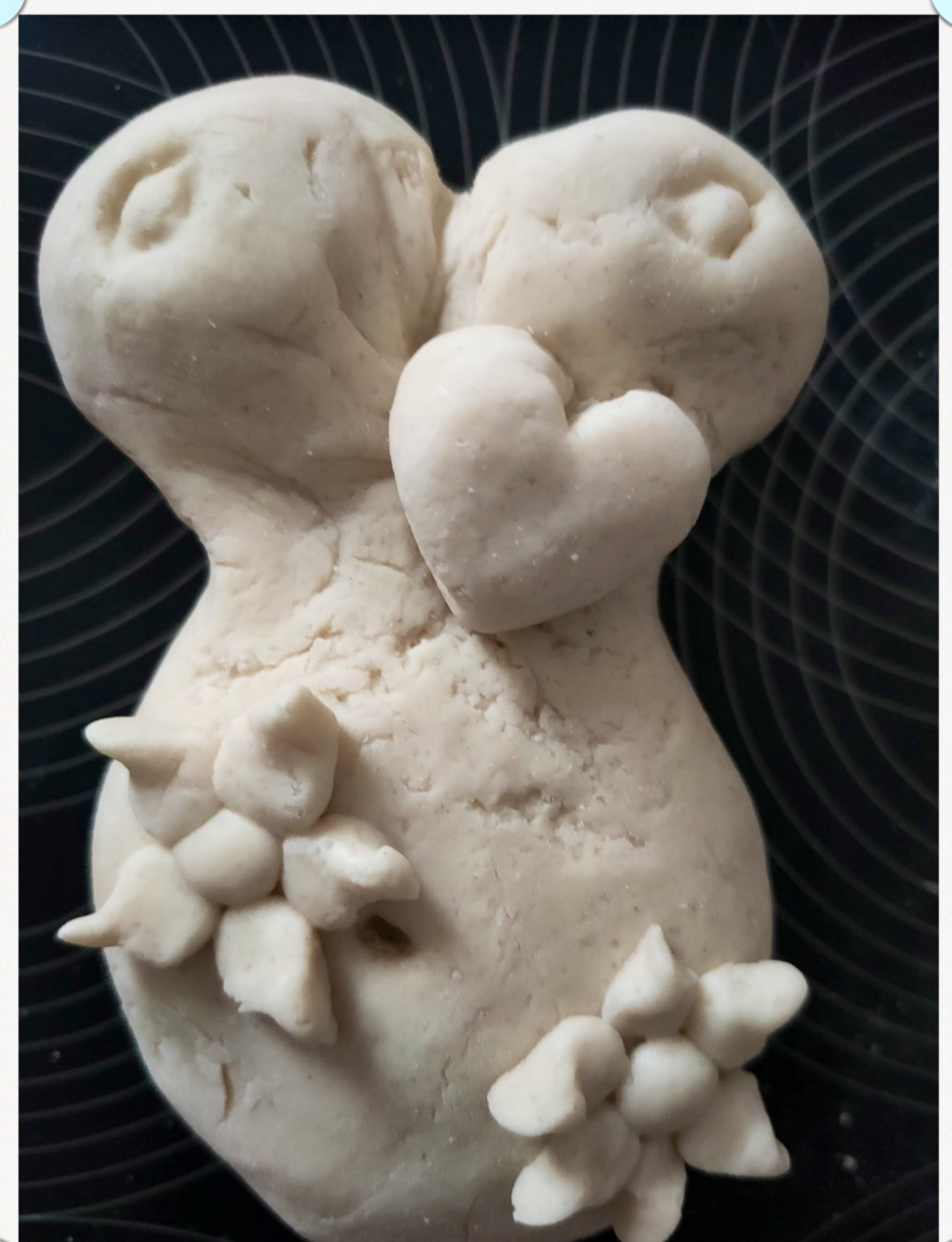
RIFIUTO - EVOLUZIONE - BELLEZZA

I nostri elaborati realizzati durante il CORSO