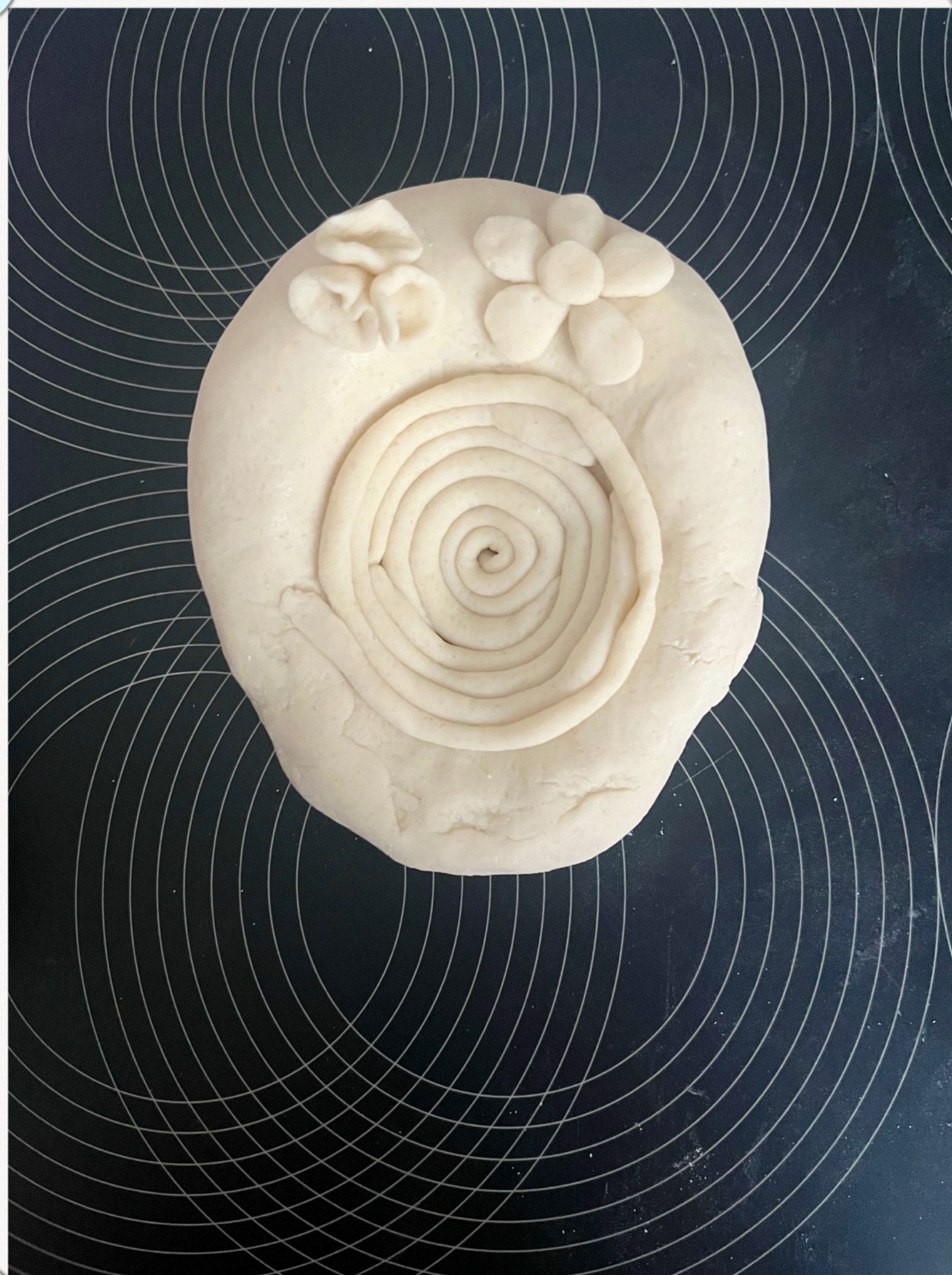
ENTUSIASMO - VORTICE - ENERGIA

I nostri elaborati realizzati durante il CORSO