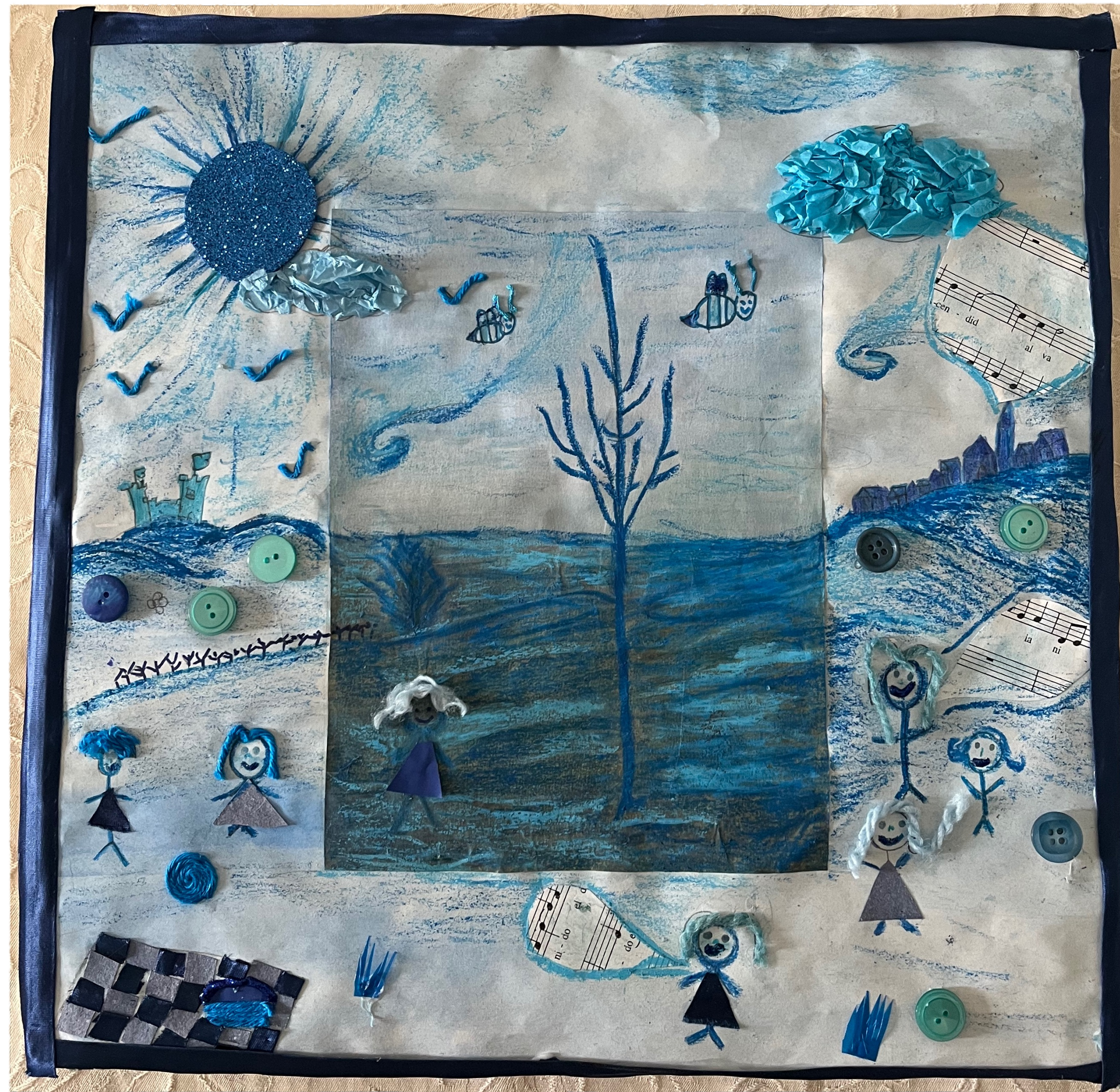
Opera realizzata dagli allievi della Scuola Primaria di Frassinello (AL) - pluriclasse.